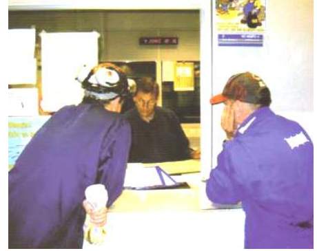
Werkvergunning dagelijks verlengen