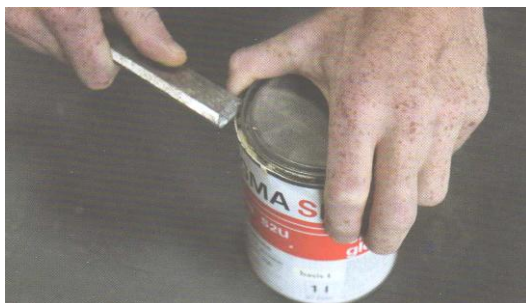
Onjuist gebruik gereedschap!

Iedere werknemer moet zorgen voor zijn eigen veiligheid en gezondheid en voor die van andere betrokken personen. Het in gevaar brengen van collega's, bezoekers of anderen (zelfs mensen die