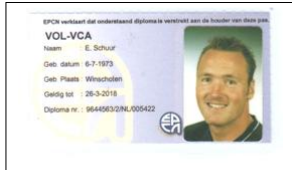
Toetsmatrijs: Toetstermen 'Basisveiligheid VCA'

In deze opleiding worden de volgende onderwerpen behandeld: